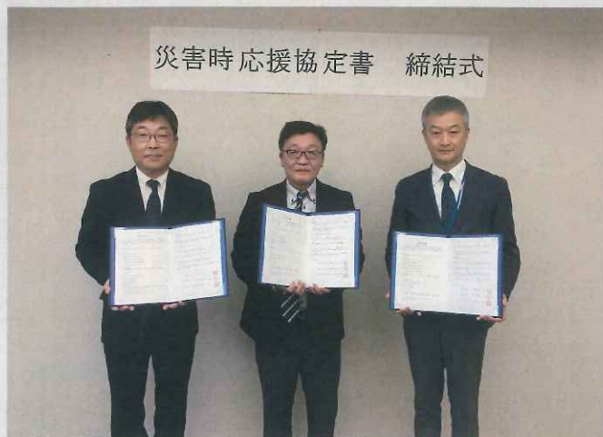
災害時 応援協定書 締結式

令和6年3月11日に障害者支援センター御所野に隣接する社会福祉法人秋田けやき会の特別養護老人ホームやすらぎホームけやき様及び地域密着型特別養護老人ホームふらっとけやき様と事業継続計画(BCP)に係る大規模災害時及び火災発生時の応援について、災害時応援協定書を締結しました。 今後も秋田けやき会様を始め、地域の方々のご協力をいただきながら、地域と共に歩む施設を目指してまいります。