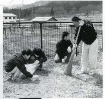
地域生活に向けた訓練を行っています。