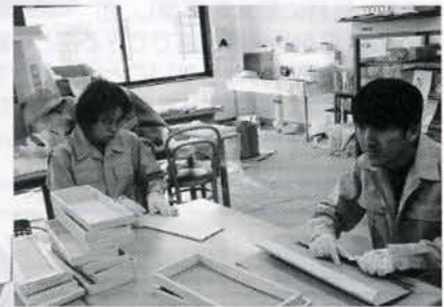
うどんの箱作りや、石けん作りを行っています。