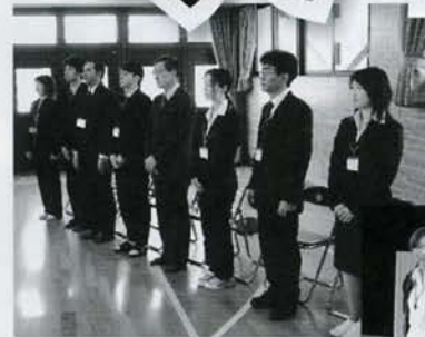
よろしく お願いします。