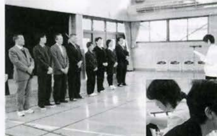
お世話になりました。