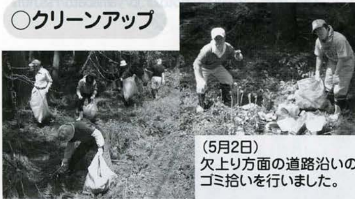
(5月2日) 欠上り方面の道路沿いのゴミ拾いを行いました。