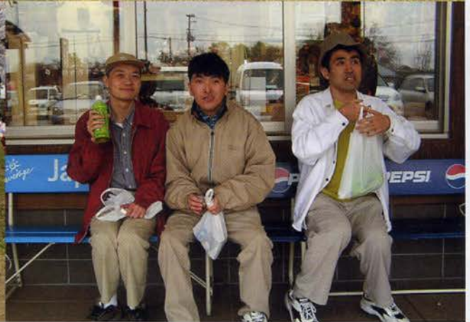
4月22日・24日 観桜会の様子