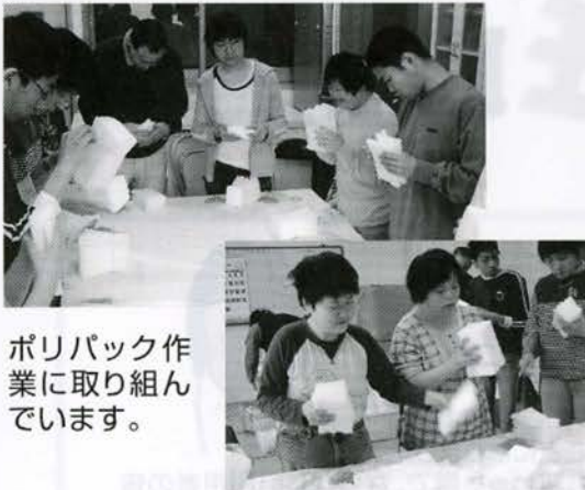
ポリパック作業に取り組んでいます。