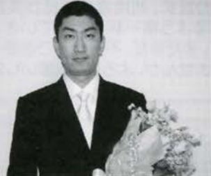
家庭からゆざわ温泉に通って頑張るようになりました。