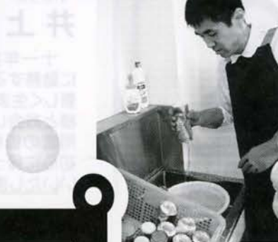
空き缶リサイクルに集中してとりにくんでいます。