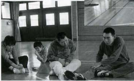
ウォーキングやストレッチの後モップがけをしています。