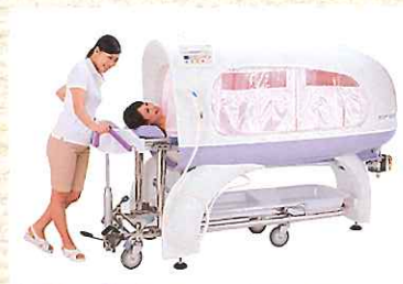
寝た姿勢で 入浴できる浴槽