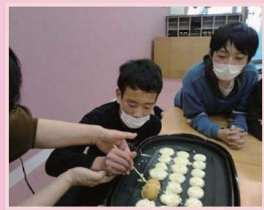
クッキングでチョコたこ焼きを作ったよ。