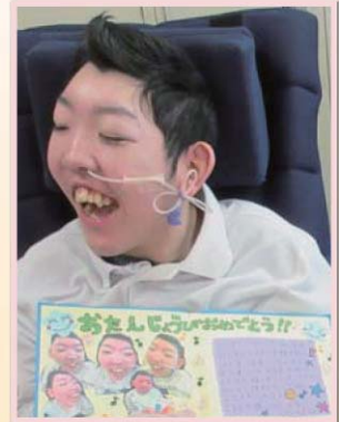
誕生日おめでとう!