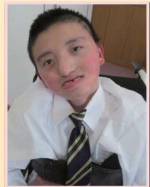
高校3年生になったよ。