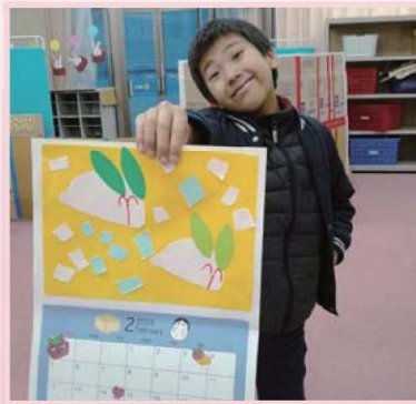
2月のカレンダー制作をしたよ