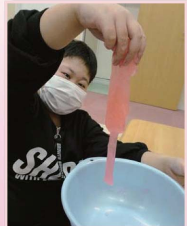
スライムが出来たよ。