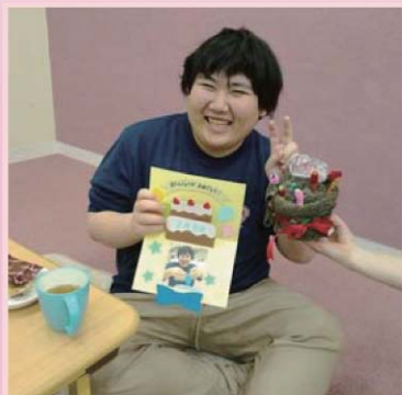
誕生日会でみんなにお祝いしてもらったよ。