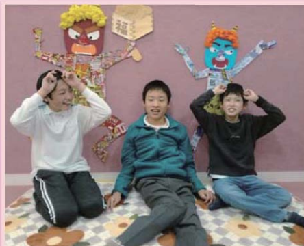
節分の鬼の前で「ハイ、ポーズ」