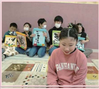
書初めをしたよ!みんな上手に書けたでしょ!