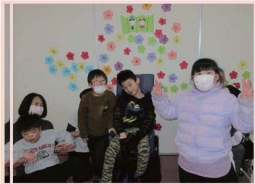
みんなでイエーイ!