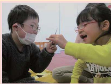
仲良くトランプ遊び。どのカードにしようかな?