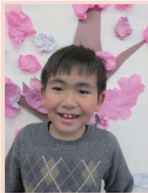
桜の木を作ったよ。