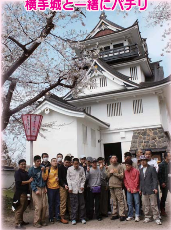
横手城と一緒にパチリ