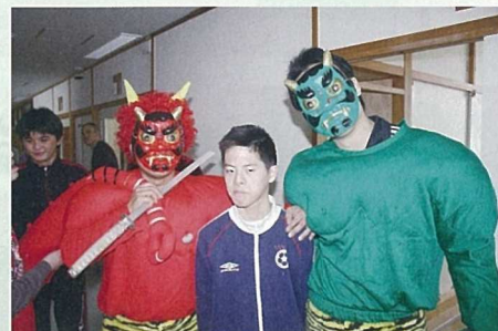
鬼の登場に皆さんビックリしていましたが、職員と分かって一安心。