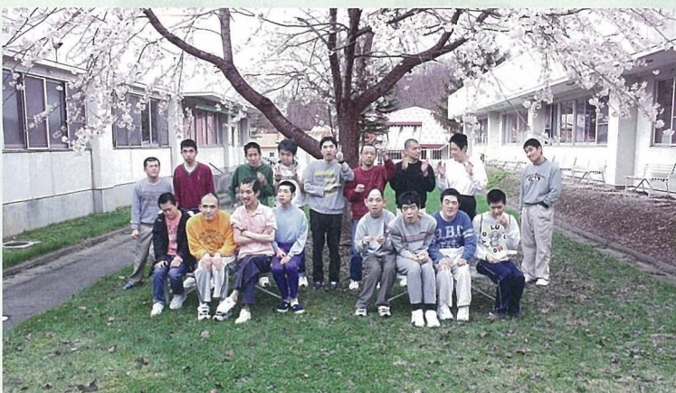
今年の桜は4月16日にはもう満開になり、天気の良い日は皆で花見をして楽しんでいます。