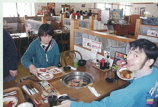
食べ放題のお店に行って、お寿司と焼肉を食べて来ました。お腹いっぱい食べて笑顔もいっぱいでした。