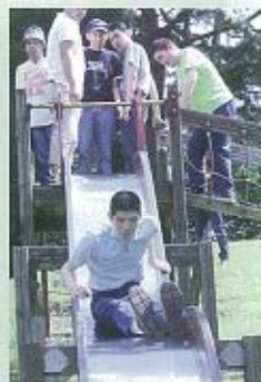
秋晴れの中、五輪坂のアルカディア公園へ行って来ました。公園の遊具で思いっきり遊んで、お昼は顔と同じ位の大きく、太いエビフライを食べて楽しんで来ました。(^^)/