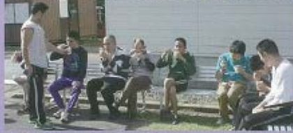
秋と言ったら、「食欲の秋」みんなでカップラーメンを食べて大満足!